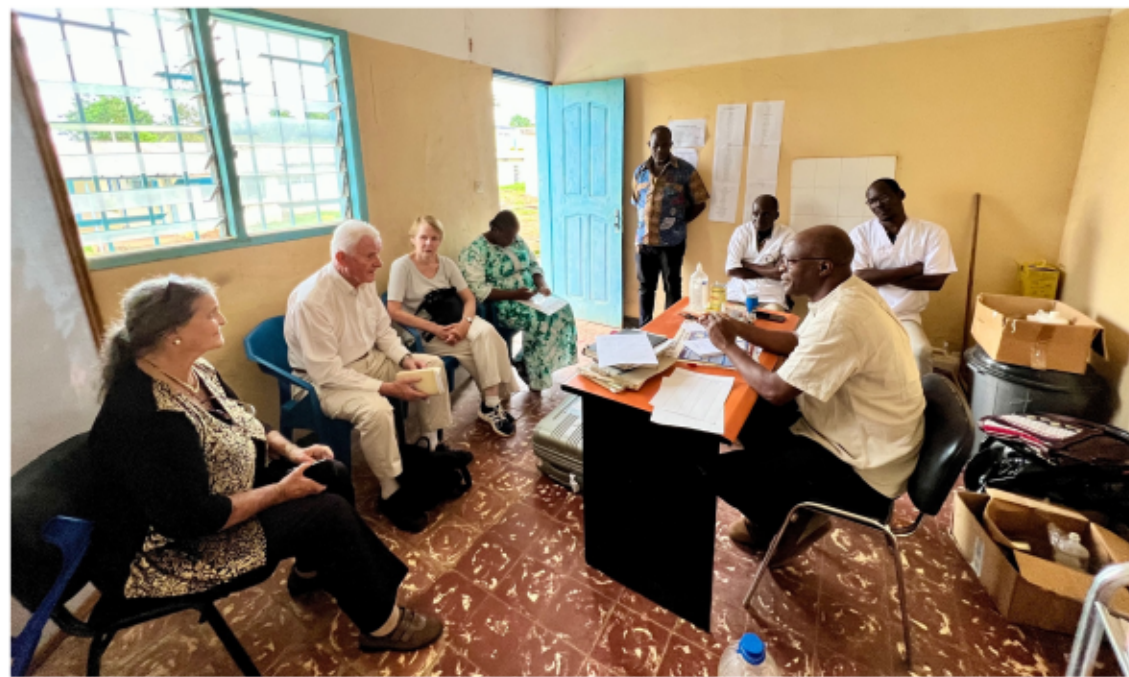
Don de matériel de soins au médecin chef